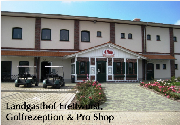
Landgasthof Frettwurst, Golfrezeption & Pro Shop