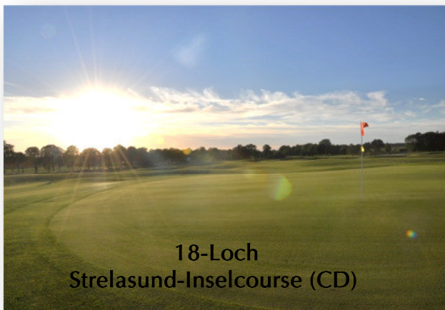
18-Loch Strelasund-Inselcourse (CD)