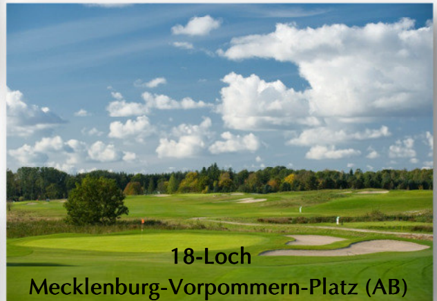
18-Loch Mecklenburg-Vorpommern-Platz (AB)