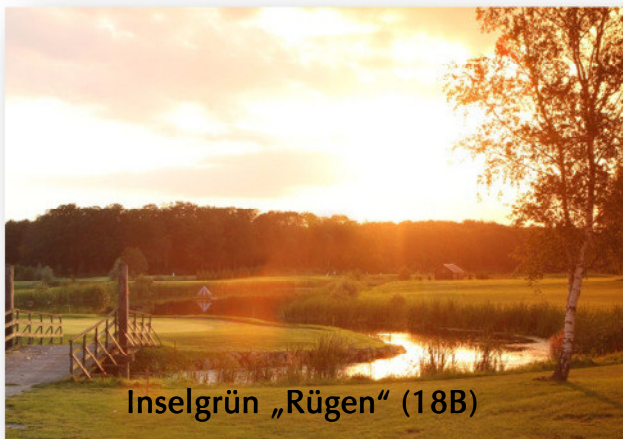
Inselgrün „Rügen“ (18B)